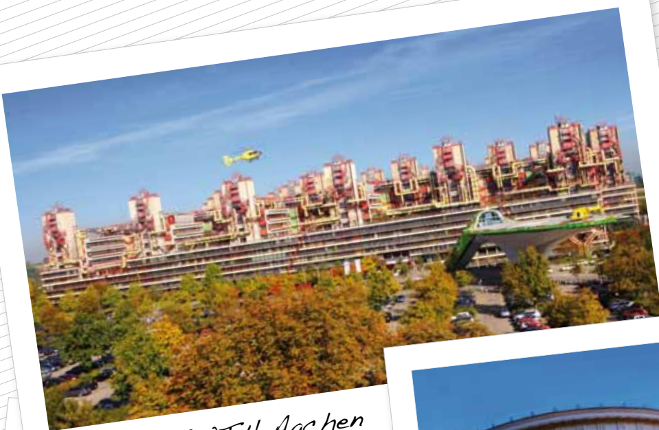
Uniklinik RWTH Aachen